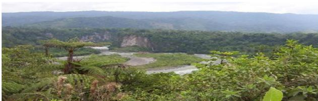
El Río UPANO en los alrededores de Sucua.