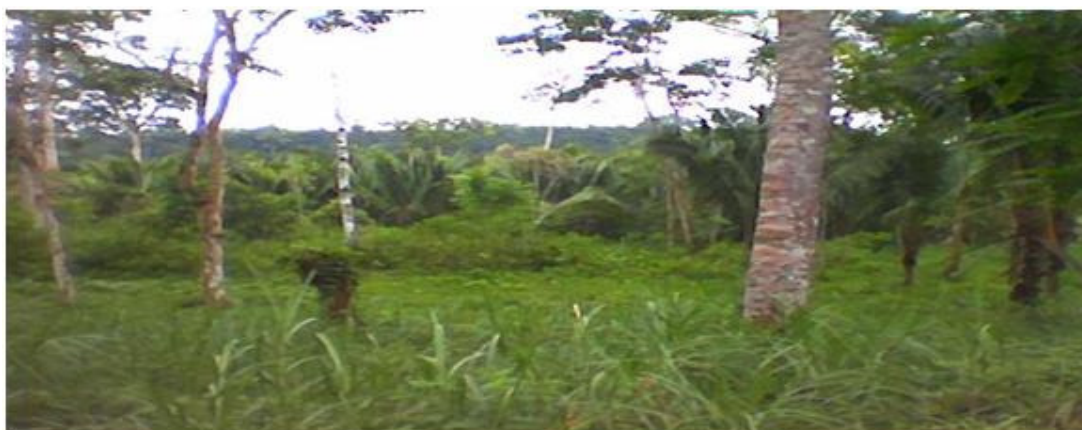
Terrenos del futuro CAE/Ecuador.

Dicho terreno se ha segregado de una finca de 100 ha de uso agrícola y ganadero. Su propietario, colaborador del Proyecto INTER/SUR, ha manifestado su disposición a ponerla, parcial o totalmente, al servicio del mismo si fuera necesario. 9