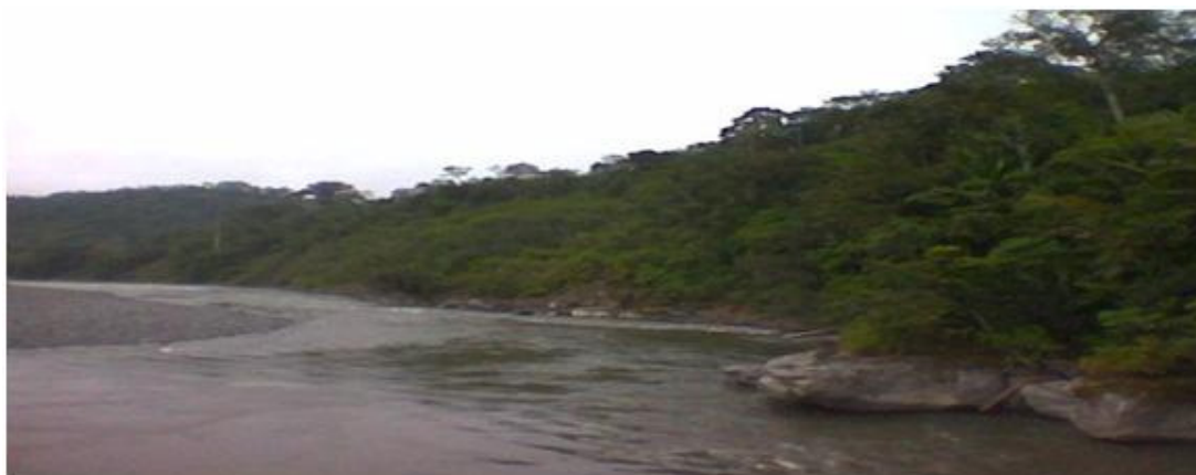
El río Upano a su paso por el emplazamiento del futuro CAE/Ecuador.