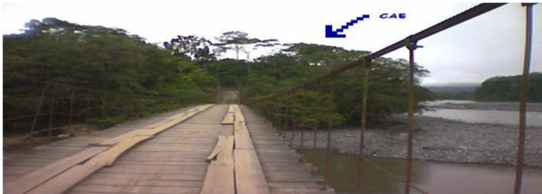
Puente colgante sobre el Upano que une el cercano poblado Shuar con la carretera del Oriente. La flecha señala el terreno, a orillas del Upano, del futuro CAE/Ecuador.