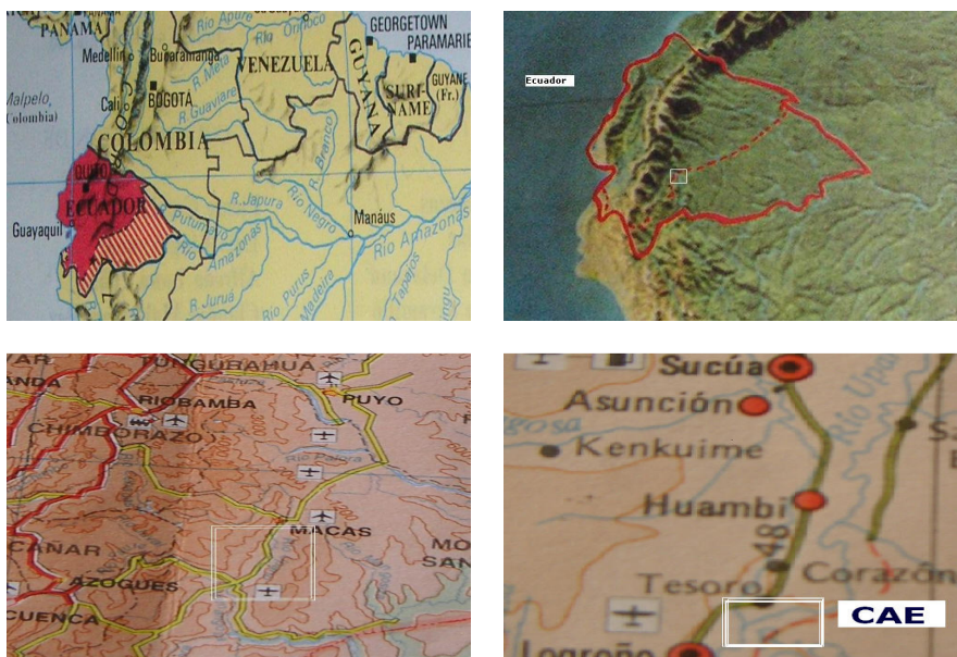
Emplazamiento del futuro CAE/Ecuador 7

La propiedad tiene una extensión de 12 ha. Se accede a ella por la carretera del Oriente, de la que dista 0'5 km. Está situada a orillas del río Upano, a una altitud de 700 m, en una zona de clima tropical húmedo. El aeropuerto más cercano, con vuelos diarios a Quito, se encuentra en la ciudad de Macas, 8 a 32 km de distancia.